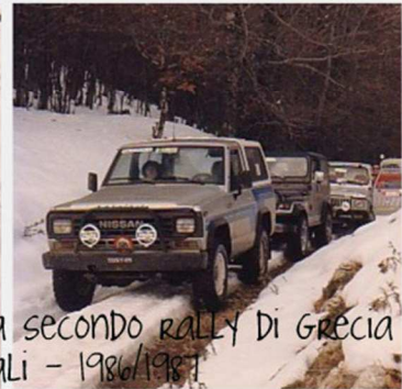
CRF storia - Partenza secondo rally Di Grecia e uscite sociali - 1986/1987